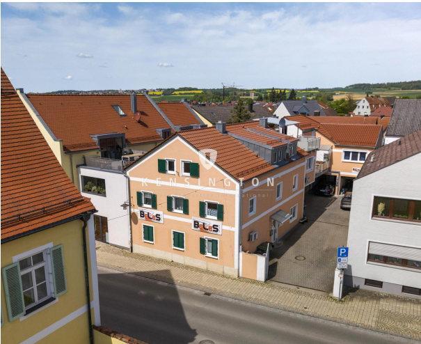
Generalsaniert, PV uvm!