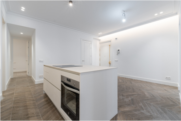
Toledo 4, Madrid-13