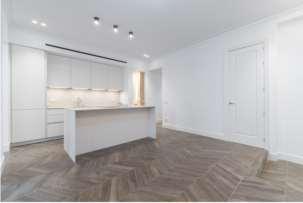
Toledo 4, Madrid-11