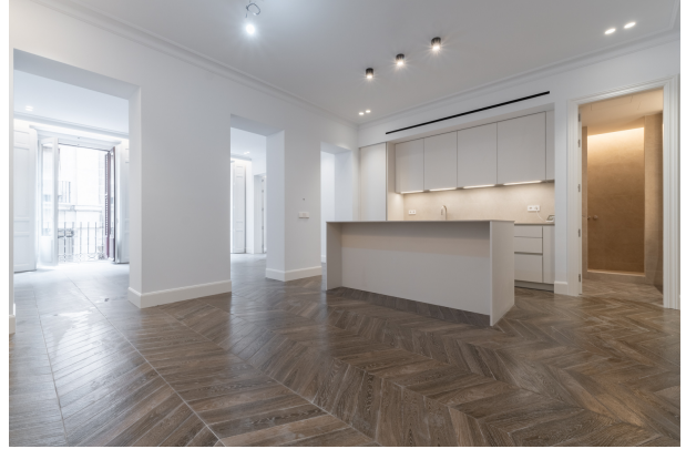
Toledo 4, Madrid-12