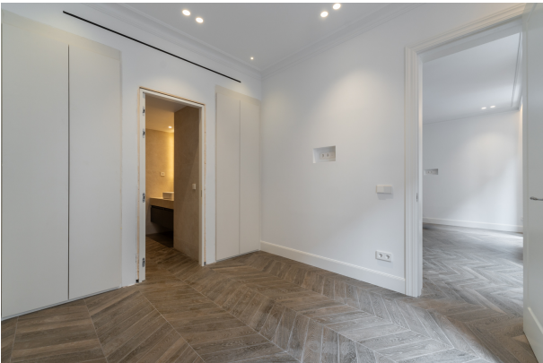
Toledo 4, Madrid-7