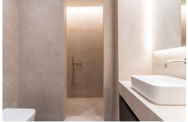
Toledo 4, Madrid-5