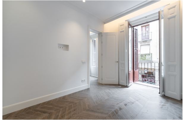
Toledo 4, Madrid-8