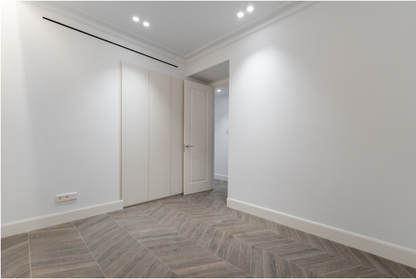
Toledo 4, Madrid-3