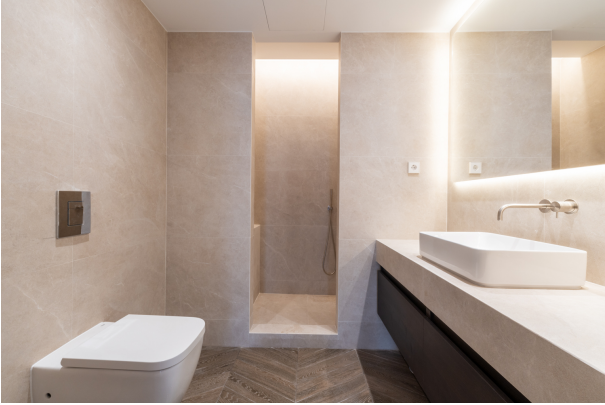
Toledo 4, Madrid-9