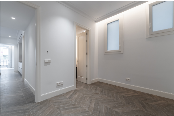
Toledo 4, Madrid-4