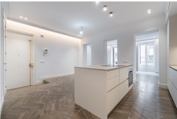
Toledo 4, Madrid-15