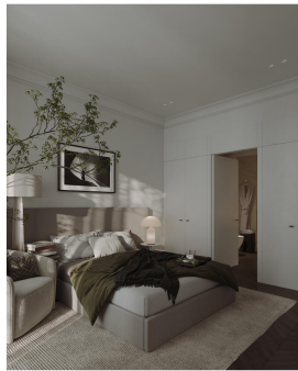
Dormitorio ppal 02