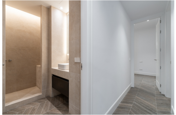
Toledo 4, Madrid-6