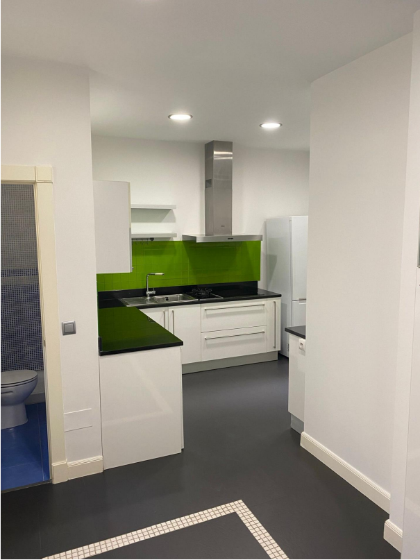
WhatsApp Image 2024-06-19 at 12.35.46