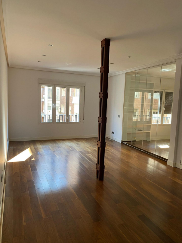
WhatsApp Image 2024-06-19 at 12.35.43 (1)